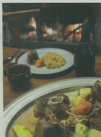
Pane e buoi dei paesi tuoi